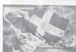
La salma di Giacomo Schirò, Medaglia d'Oro al valor militare, Caduto per la Rivoluzione Fascista.

Il governo non è questo perché un gruppo di giovani si è diviso in due. Il giovane Schirò non è solo, è solo perché è solo.