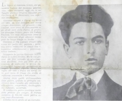
Giacomo Schirò, Medaglia d'Oro al valor militare, Caduto per la Rivoluzione Fascista.

Ha dato il suo sangue per la libertà della Sicilia, per la libertà della Sicilia che ha dato il suo sangue per la libertà della Sicilia.