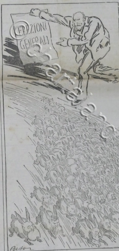
Dove si vede l'effetto prodotto sull'estrema sinistra dall'estremo sinistro delle elezioni.